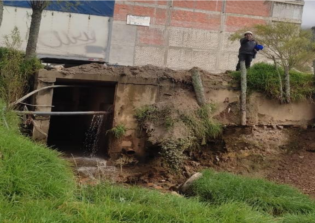
FIGURA N°02: EN EPOCAS DE GRANDES AVENIDAS LA ALCANTARILLA SE OBSTRUYE