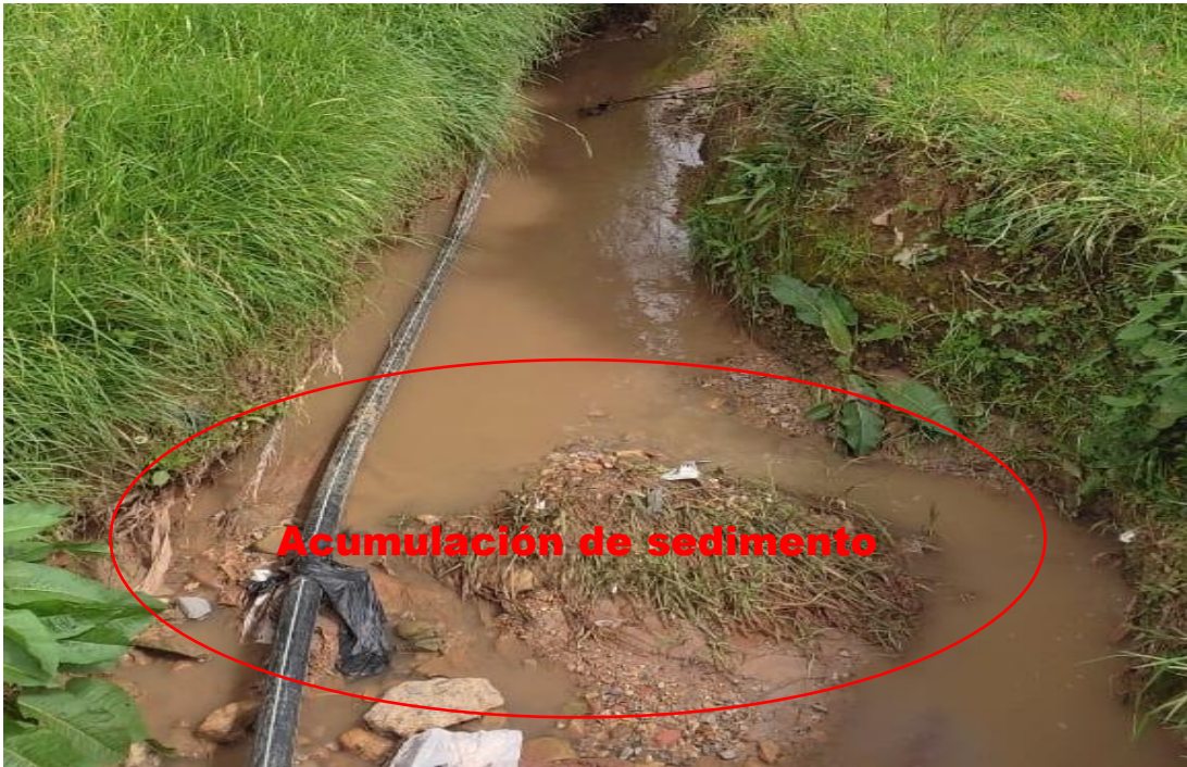
FIGURA N°01: MATERIAL COLMATADO EN EL CAUCE DE LA QUEBRADA PAQUISHA, CON UNA PROFUNDIDAD PROMEDIO DE 0.5 M.